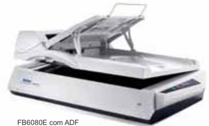
FB6280E com ADF

PaperPort é a maneira mais fácil de transformar pilhas de papel e fotos em arquivos organizados que você pode encontrar rapidamente, usar e compartilhar. Pare de perder tempo à procura de documentos. Fim da frustração de organizar, editar e partilhar as suas fotografias digitais. PaperPort torna mais simples para conectar o scanner e computador. Ele é a solução